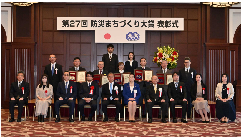
第27回 防災まちづくり大賞 表彰式