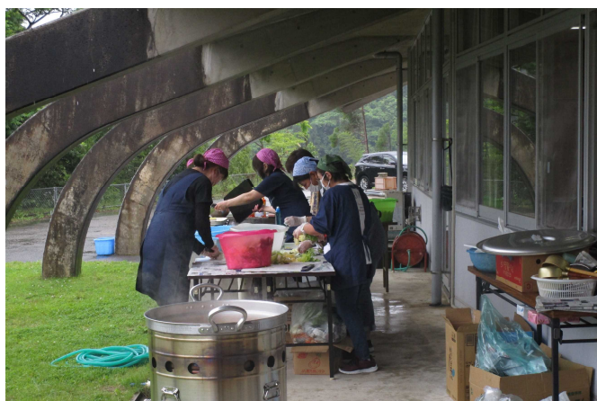
▲炊き出し訓練の様子