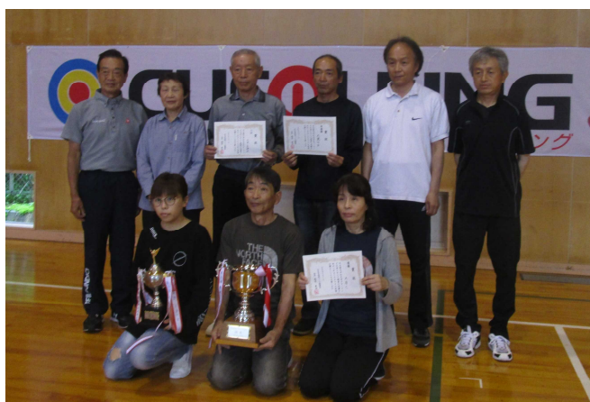
▲前列大窪C、後列右から大覚口B、上中・吉池A

6月11日（日）仏生寺体育館でカローリング大会を開催しました。30チームが参加し、各チーム2試合ずつ行い、合計得点で順位を競いました。4年ぶり（コロナ禍3年間休止）に防災訓練を兼ねた炊き出しも行い、参加者の昼食として豚汁、アルファ米が提供されました。なお、炊き出しはスポーツ委員会女性会員の指導のもと各集落の輪番制です。（今回は鞍骨3人、大覚口2人）成績は、優勝…大窪C、準優勝…大覚口B、三位…上中・吉池A