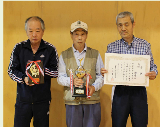
▲優勝の鞍骨Dチーム