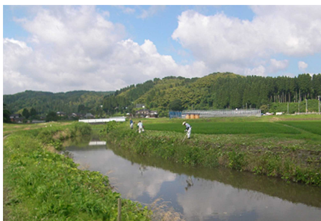
▲環境美化活動の様子