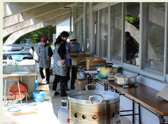
▲炊き出し訓練の様子