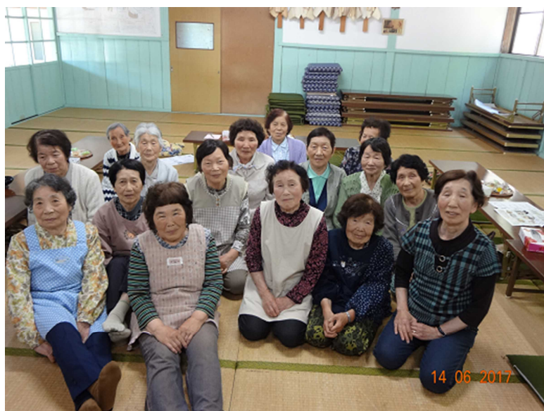
▲「めぐみの会」のみなさん