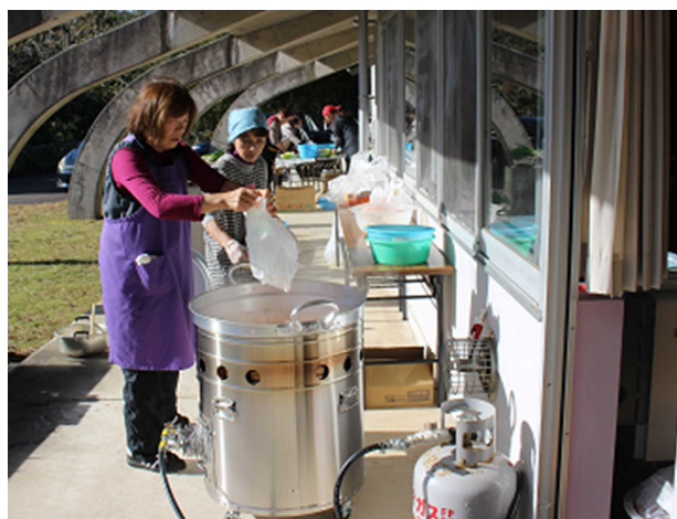
▲炊き出し訓練の様子

カローリング大会の昼食は、万が一の災害に備えた炊き出し訓練として、各集落の輪番制で実施しています。この訓練で使用した炊き出し用鍋は、おらっちゃん創生支援事業を活用して新たに整備した防災備品の一つです。これまで使用してきた鍋は、重たく持ち運びが大変でした。