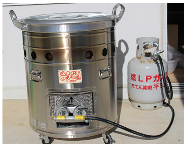
▲新たに整備した炊き出し用鍋