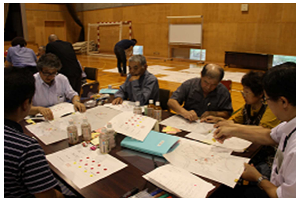
▲福祉マップづくりの様子

後半は、昨年度までに各世帯から回収した「いのちのバトン・避難支援登録シート」を基に、福祉マップづくりを行いました。