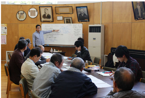
▲11月20日確認作業の様子

この確認結果を反映して完成した防災マップは、後日、各集落の公民館などに掲示する予定です。