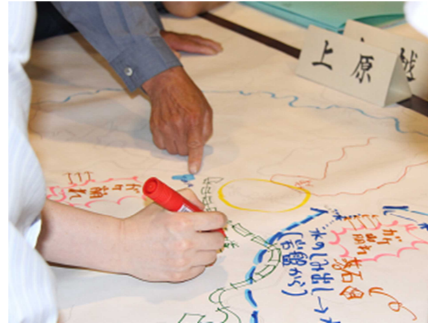
▲地図へ書き込む様子

後半は、昨年度までに各世帯から回収した「いのちのバトン・避難支援登録シート」を基に、福祉マップづくりを行いました。