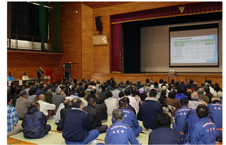
▲訓練の様子（十三中学校）

11月6日（日）に防災訓練を実施しました。内容は、仏生寺地区に大雨特別警報の発表があり、土砂災害などの発生する危険があることから、氷見市から、避難勧告が出されたことを想定し、下記の避難情報伝達の流れに基づき、十三中学校体育館に避難する訓練を行いました。また、おらっちゃん創生支援事業で購入した、非常用電源を使って、LED照明操作訓練も行いました。この備品は、万が一に備えて十三中学校で保管しています。