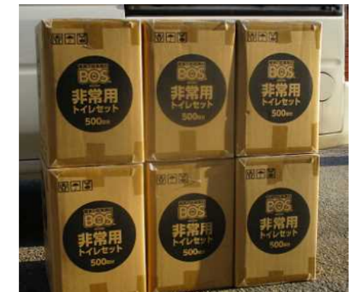
▲トイレセット（3,000回分）